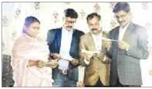
शपथ लेते अधिवक्ता।

संपन्न हुआ। कार्यक्रम के आरंभ में अतिथियों द्वारा मंत्र संस्कारों का आयोजन किया गया। कार्यक्रम का शुभारंभ किया गया। इसके उपरांत मंच पर उपस्थित सभी