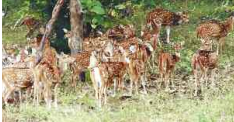
मनगटा राजनांदगांव से लाए गए चीतल।