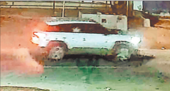
पेट्रोल पंप में खड़े चोरों की कार।