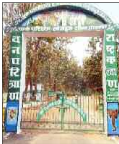
गुरुघासीदास नेशनल पार्क।