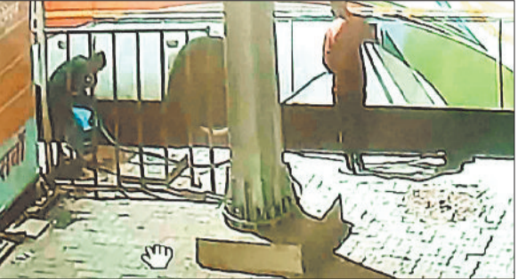
डीजल चोरी करते सीसी टीवी कैमरे में कैद आरोपी।

देर रात देते है घटना को अंजाम डीजल चोर गिराह इस कदर शांतिर है कि डीजल चोरी की घटनाओं को अंजाम देने के लिए समय निर्धारित कर रहे हैं। अब तक जितने भी डीजल चोरी की घटनाएं हुई है सभी रात 2 से 3 बजे के बीच हुई है और सीसीटीवी कैमरा में भी इसी समय चोरी करते हुए कई आरोपी सीसीटीवी फुटेज में कैद हुए हैं। चोरों को भी मान्य है कि लम्बे सफर पर निकले वाहन चालक थकान के कारण भोजन करने के कुछ समय बाद गहरी नींद में सो जाते हैं। जिससे डीजल चोरी करने के दौरान उन्हें कानून खबर नहीं लगती। चोर पंप के सहारे न सिर्फ डीजल चोरी करते है बल्कि चार पहिया वाहन का उपयोग कर डीजल चोरी कर फरार हो जाते हैं। बीती रात भी चोरों ने नयी कार के सहारे चार सौ लीटर डीजल चोरी कर फरार हो गए।