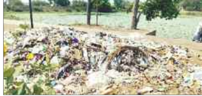
तालाब के समीप बिखरा कचरा।

तालाब किनारे डंप किए कचरे में आवारा पशु अपना निवाला खोजते हैं और प्लास्टिक का भी भक्षण करते नजर आते हैं, इसके अलावा तालाब किनारे डंप किए गए कचरा हवा के झोंके से उड़कर तालाब में मिल जा रहा है, इससे